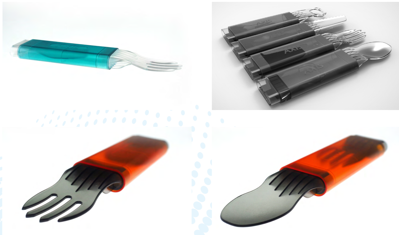
圖 1. 產品成果圖 (1)

AXIS 便攜式餐具是一款以戶外生活為主要目標市場的環保餐具，透過創新的結構設計，讓雙頭餐具中的叉子和湯匙，能夠巧妙的收納在餐具柄身中，除了攜帶方便外，同時也具備保持餐具清潔的功能。